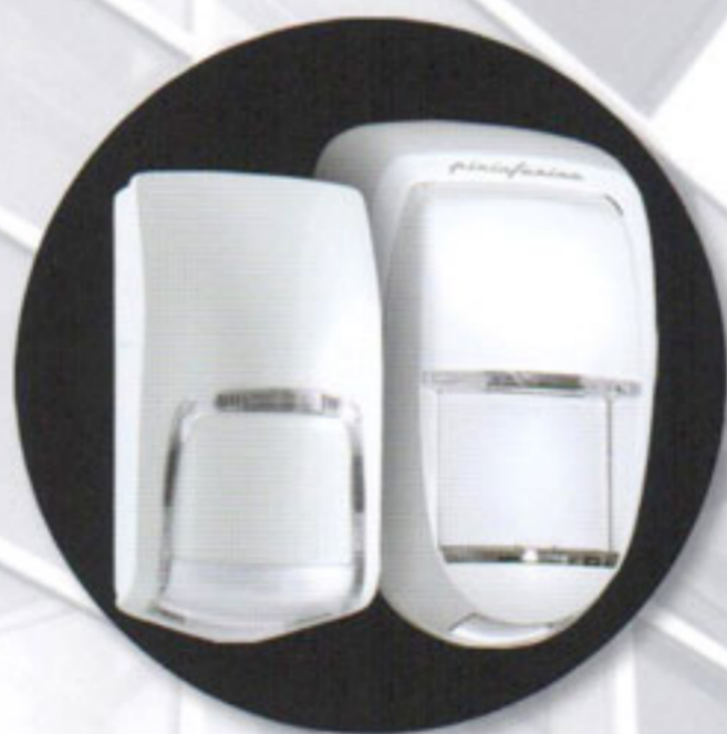
Rilevatori per interno

I componenti Tecnoalarm sono disponibili in versione cablata o wireless rigorosamente realizzati in doppia banda di frequenza, per garantire non solo una facile installazione nei punti di difficile accesso, ma anche e soprattutto una buona qualità nel livello di trasmissione e ricezione dei segnali radio. L'interfaccia è user-friendly con sistemi di comando che prevedono anche funzioni interattive vocali.