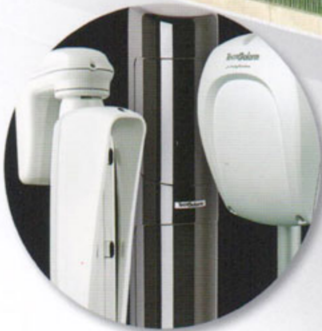
Protezioni per esterno